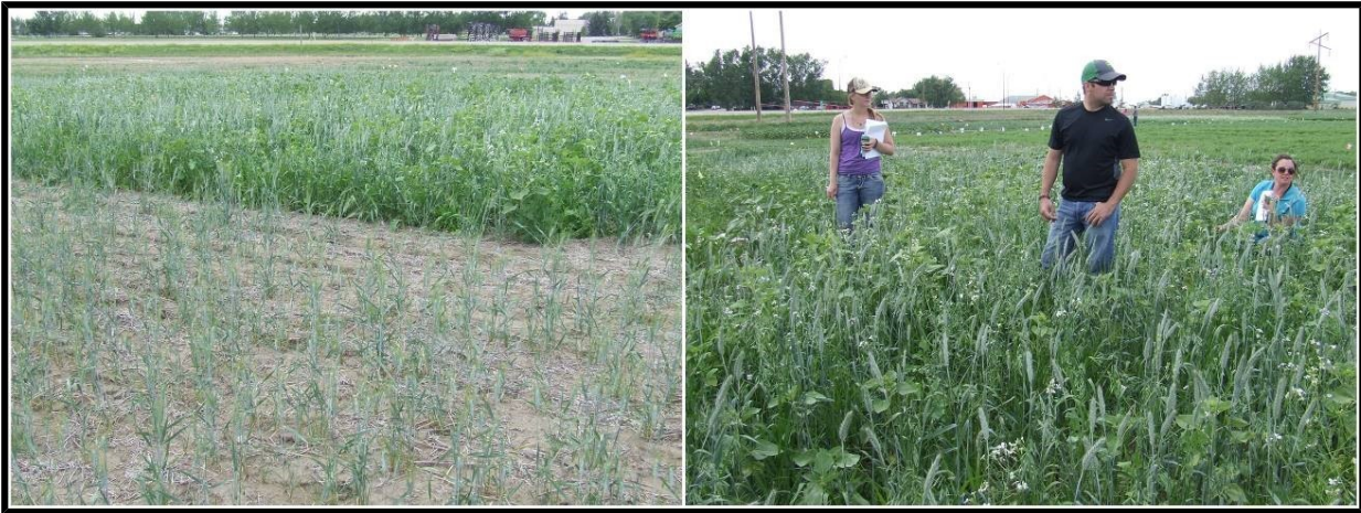
Fig. 3. Triticale Monokultur (linker Vordergrund) leidet unter schwerem Wasserstress während Triticale, die mit anderen Arten zusammen gesät wurde (Hintergrund und rechts) vor Kraft strutzt. Zusätzlich zur Triticale enthielt die „Cocktailfrucht“ Hafer, Ackerradieschen, Sonnenblumen, Ackererbsen, Saubohnen, Kichererbsen, Rispenhirse und Kolbenhirse. Chinook Applied Research (CARA), Oyen Alberta.

Ein großartiger kleiner Blog über die Dürretoleranz-Vorteile von „Pflanzenkommunen“ ist der in der Referenz 13, am Ende dieses Dokumentes aufgeführt.